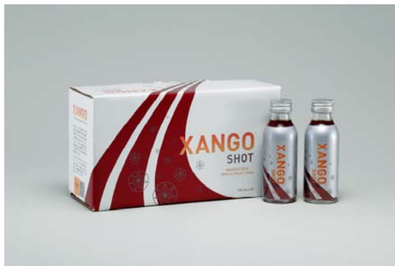
XANGO SHOT (ザンゴ ショット)

株式会社ザンゴ ジャパンでは、5月20日(日)、ザンゴ ジャパン イベント2007と銘打った1周年記念を開催します。この機会に、より多くのお客様に、より気軽にザンゴ ジュースをお召し上がりいただけるよう、“ザンゴ ショット”(100ml)を、世界に先駆け日本で先行販売いたします。“ザンゴ ショット”は、ザンゴ ジュースの飲みきりサイズ。“ザンゴ ショット”の販売は、5月20日より開始し、限定本数(世界200,000本)の売り切れ次第終了いたします。